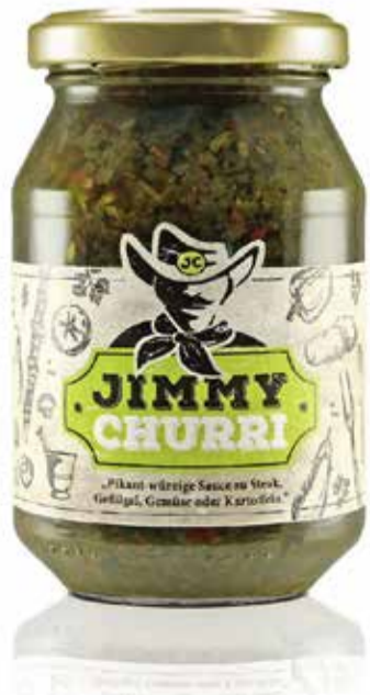
Cooler Name, toller Geschmack: Jimmy Churri, die leckere Sauce von Wajos, eignet sich perfekt fürs Marinieren.

eingeladen ist und noch nach einem besonderen Mitbringsel sucht, der sollte auf jeden Fall einmal bei Wajos vorbeischaun. Hier gibt es besondere Öle, die sich wunderbar für Salatsaucen eignen. Aber auch fantastische Gewürze für Gemüse und Fleisch, mit denen sich geniale Dips und Saucen kreieren lassen.