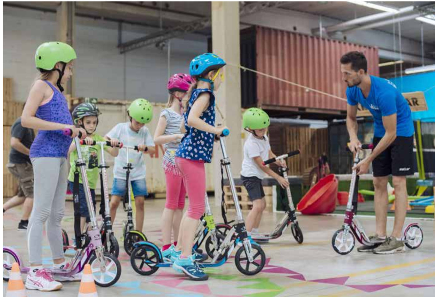
Unter fachkundiger Anleitung lernen die Kids und Teens beim Back-to-School-Programm den besten Umgang mit einem Scooter.

Zwischen 11 und 16 Uhr finden dort jeweils zur vollen Stunde Scooter-Trainings statt. Treffpunkt ist der HUGODROM-Stand. Die Kinder lernen dann das Wichtigste zum Umgang mit einem Scooter. Nicht nur Aufbau und Einstellung, sondern auch