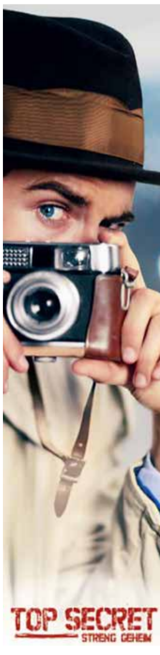
Top-Secret wird der Top-Event in der zweiten Jahreshälfte im Allee-Center.

Rheinisch-Bergische Druckerei GmbH Zülpicher Str. 10, 40549 Düsseldorf-Heerdt