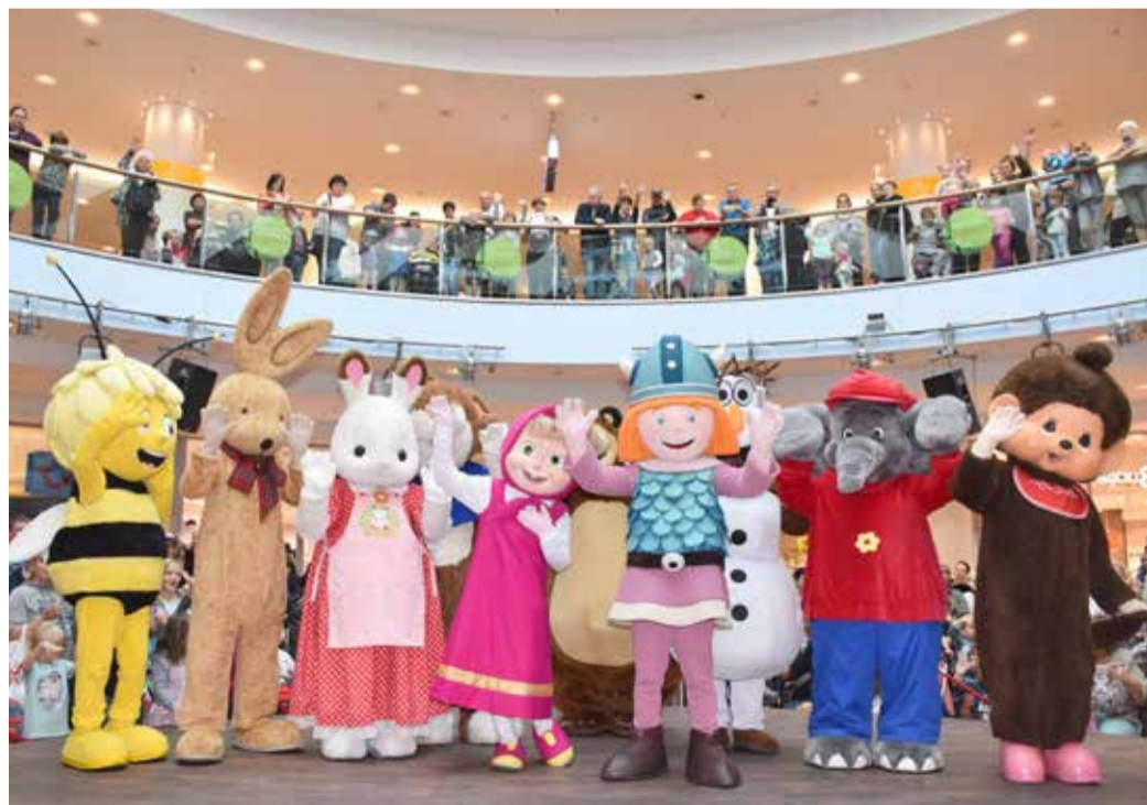
Bekannte Figuren aus Kinderbüchern und -sendungen sind bald wieder zu Besuch – wie hier in einem ECE-Center.

Auf der Bühne wird dann jeweils die Geschichte des einen oder anderen Charakters kurz erzählt. Warum reibt sich zum Beispiel Wickie immer die Nase? Wie alt ist eigentlich mittlerweile Felix der Hase? Auf die Antworten dürfen die jüngsten Center-Besucher ebenso gespannt sein wie auf das große Finale. „Die Mas-