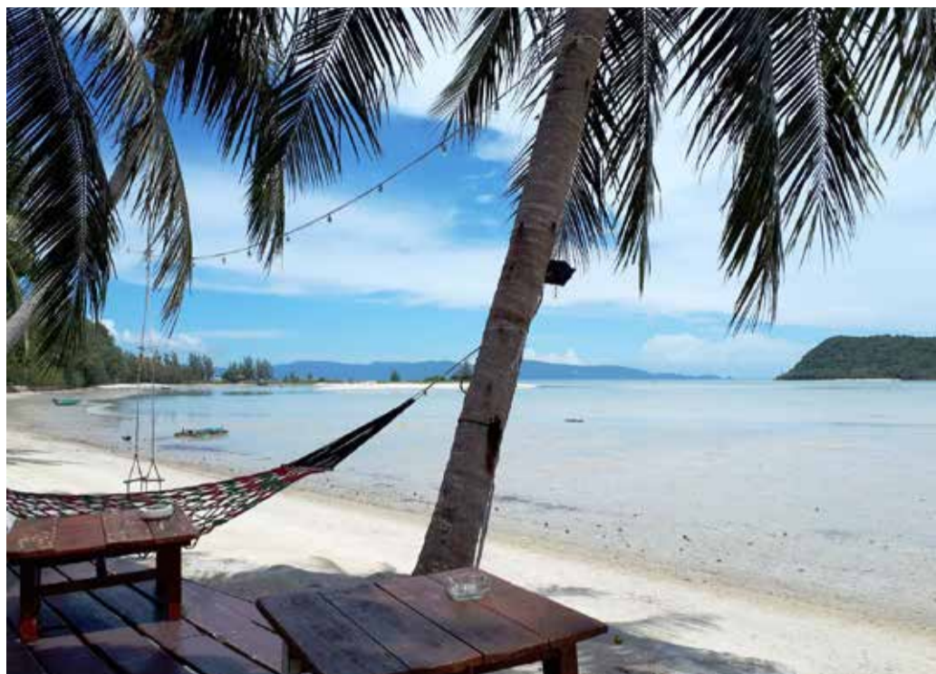
Einfach aufs Meer schauen und die Seele baumeln lassen? Perfekt beraten werden die Kunden von den Reiseexperten im Center.

Sehr praktisch bei Thomas Cook: In der Lounge Zone können die Kunden auf bequemen Sitzmöbeln ihre Reise suche auf iPads selbst be-